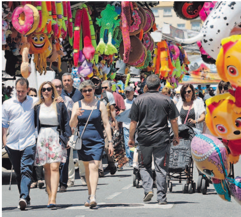
Esta imagen del bullicio en el puerto con motivo de las fiestas no se verá este año.

Son muchas las dificultades. No solo por las restricciones que imponen las autoridades en esta situación de alerta sanitaria, que ya hacen imposible la celebración, si no también por las dificultades económicas para recaudar el presupuesto suficiente para financiarlas, dado que la hostelería y los negocios locales han estado y aún están en la mayor parte de los casos cerrados y en